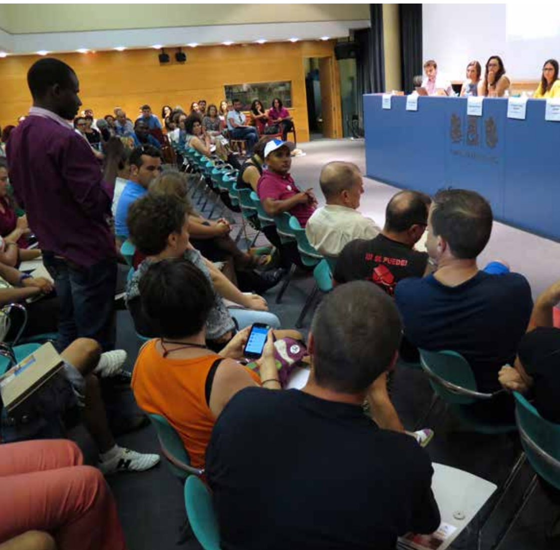
Imagen del seminario organizado en 2015 en Les Corts Valencianes